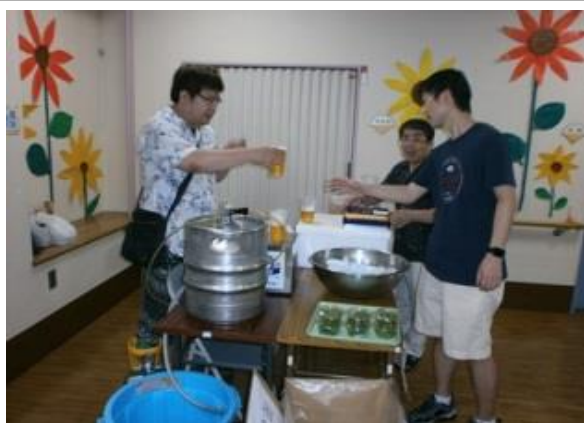
生ビールも格安ですよ～