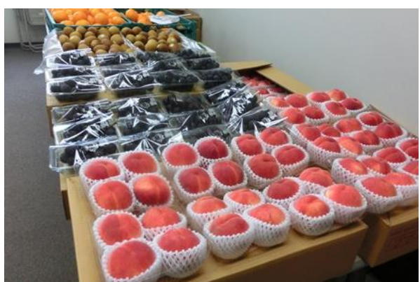
大好評の産直コーナー