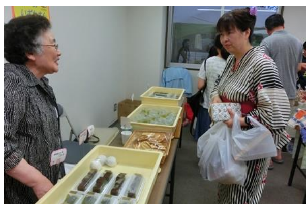
団子も売ってます