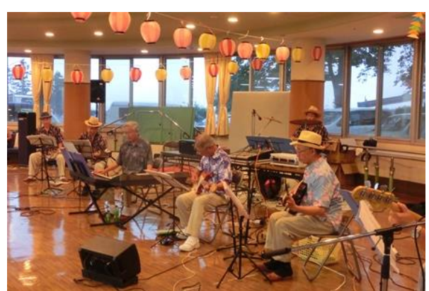
おなじみの手代森サウンズ様