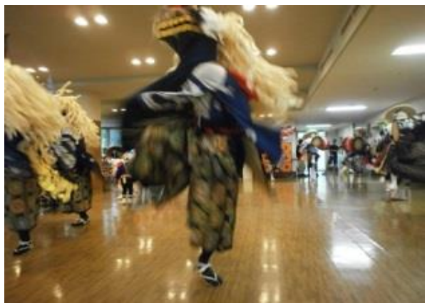
勇壮な澤目獅子踊り保存会様