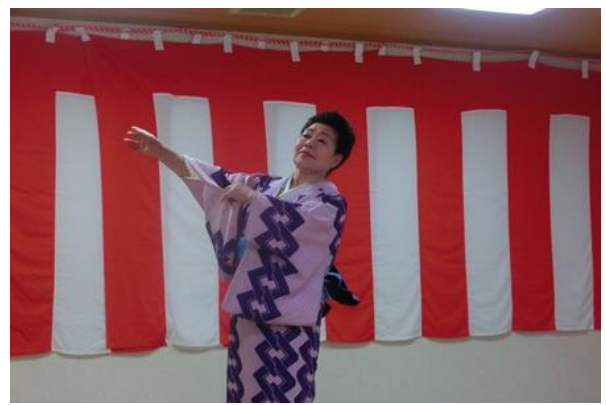
北柳会興華柳様の華麗な踊り