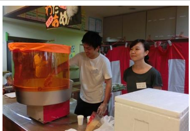
わたあめやかき氷あり☑