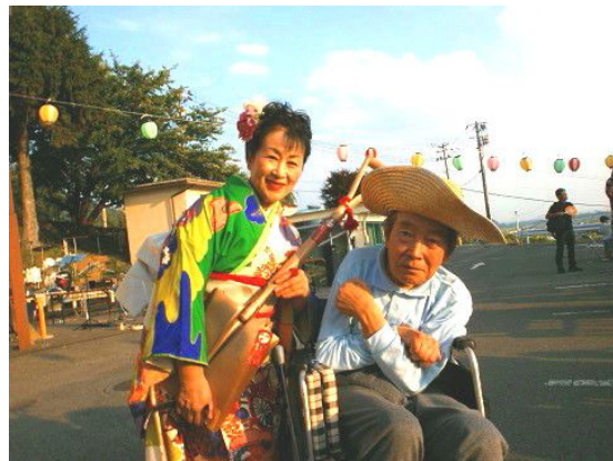
スコップ三味線の奏者と記念撮影