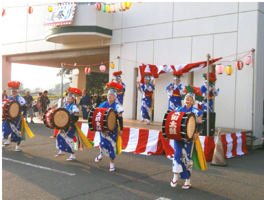
太田太鼓の勇壮な踊り